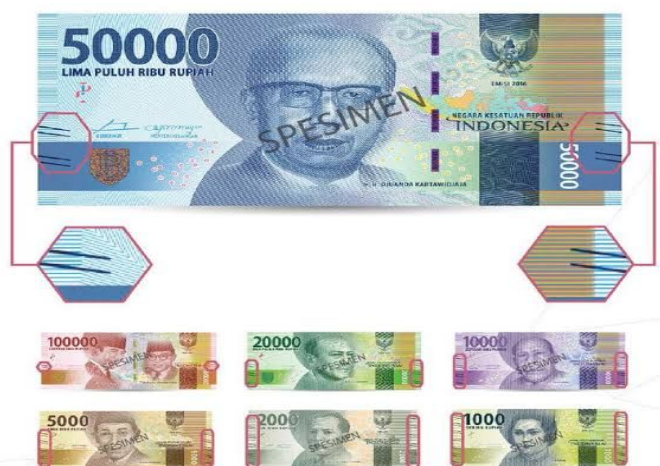
Gambar 1. Tanda/symbol yang dapat diraba oleh tunanetra

Proses jual beli biasanya melibatkan dua belah pihak yang dilakukan ditempat-tempat umum seperti di toko atau pasar. Dalam melakukan transaksi antar penjual dan pembeli tentu menggunakan uang, namun Sebagian orang masih mengalami kesulitan dalam melakukan hal tersebut dikarenakan beberapa orang memiliki kekurangan pada indera penglihatan seperti penyandang tunanetra. Bagi penyandang tunanetra dalam membedakan nominal uang sangat sulit untuk dilakukan. Sejauh ini, cara yang digunakan para penyandang tunanetra untuk membedakan nominal mata uang kertas ialah dengan cara menyusun nominal uang kertas tersebut, melipat uang untuk mengetahui nominalnya serta ada juga yang menyentuh tanda yang dibeli pada masing-masing uang oleh pemerintah seperti yang diperlihatkan pada gambar berikut ini.